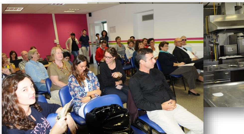
Spotkanie z przedstawicielami włoskich organizacji pozarządowych, było czasem wymiany dobrych praktyk.