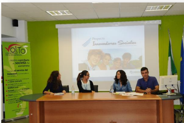
Zespół z Hiszpanii podzielił się dobrymi praktykami z realizowanych przez nich projektów.