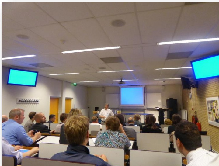
Konferencja czerwcowa – z grupą z USA

A tak przy okazji, w czerwcu w Amsterdamie, mieliśmy możliwość przedstawienia naszego pomysłu grupie Amerykanów, którzy byli bardzo zainteresowani tym co się tu dzieje - w końcu problem ubóstwa nie jest im obcy.