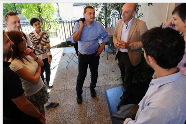
Dowiedzieliśmy się dużo o przedsiębiorczości podczas wizyty studyjnej w szkole zawodowej.