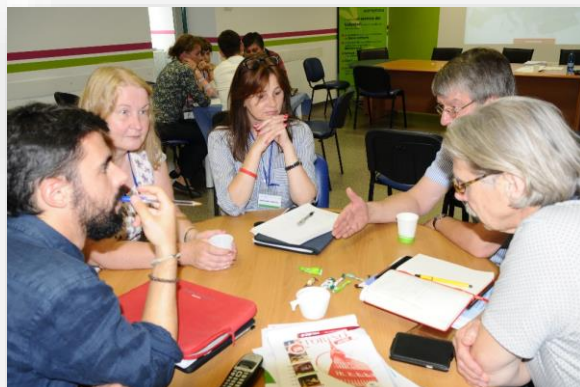
Praca w międzynarodowych grupach sprzyja kreatywności.