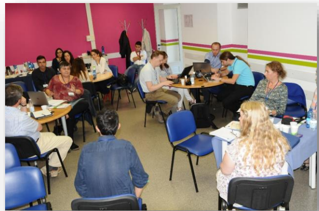
Było też miejsce na dyskusję.