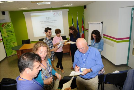
Gra Bingo pomogła nam się lepiej poznać.

lokalnych. Uczestnicy mieli czas na dzielenie się doświadczeniami, dyskusję oraz pracę. Czas wolny został również bardzo dobrze wykorzystany i jesteśmy o krok do przodu jeśli chodzi o opracowanie metodologii warsztatów – jednych dla osób zagrożonych ubóstwem, drugich dla decydentów i polityków społecznych.