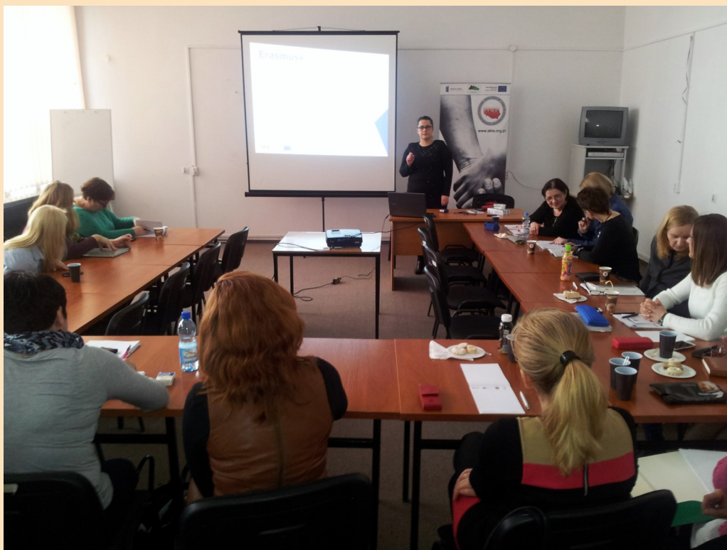
Konferencja Erasmus + Edukacja szkolna