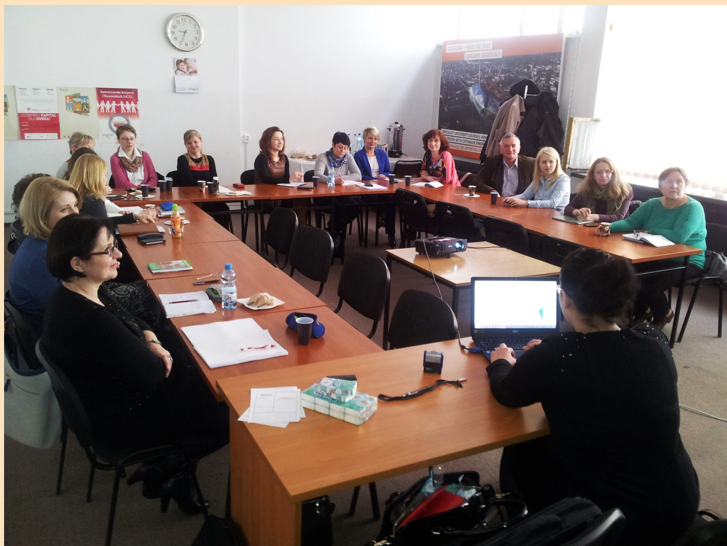
Konferencja Erasmus + Edukacja szkolna