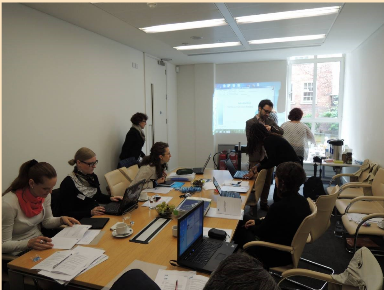
Spotkanie partnerów projektu CyberMentors Europe, Londyn