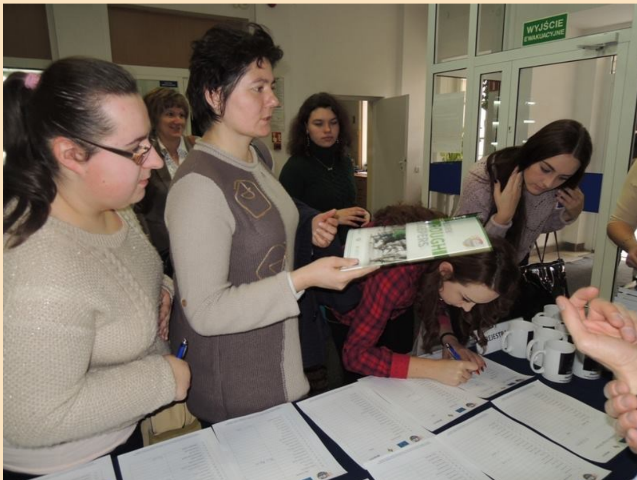
Rejestracja uczestników konferencji, w której udział wzięło ponad 150 osób