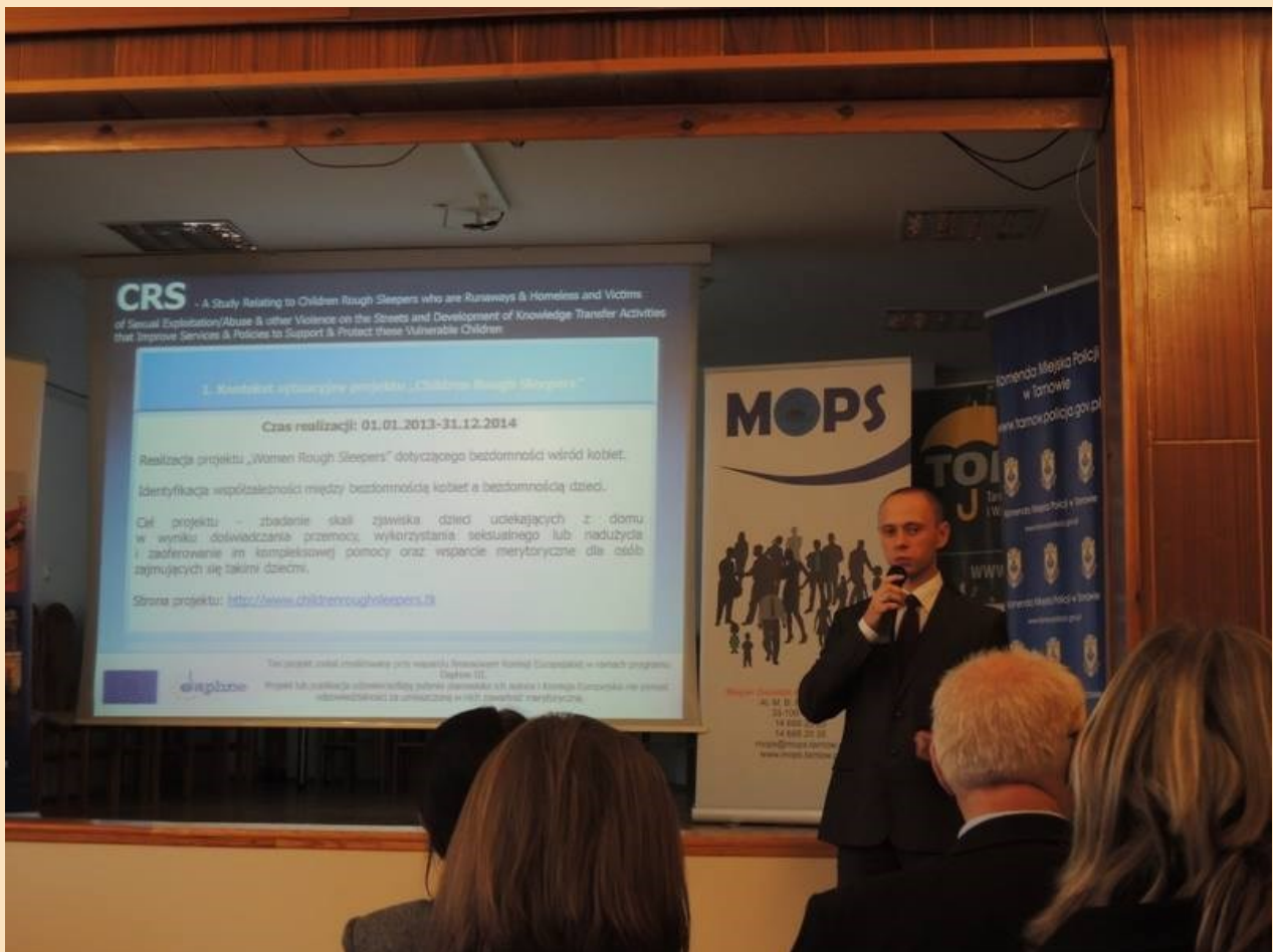
Konferencję pt. „Przeciwdziałanie bezdomności dzieci”