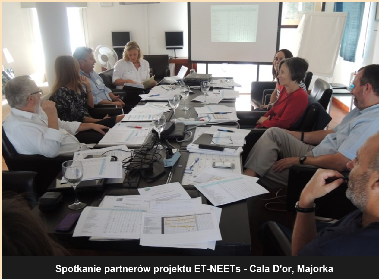
Spotkanie partnerów projektu ET-NEETs - Cala D'or, Majorka