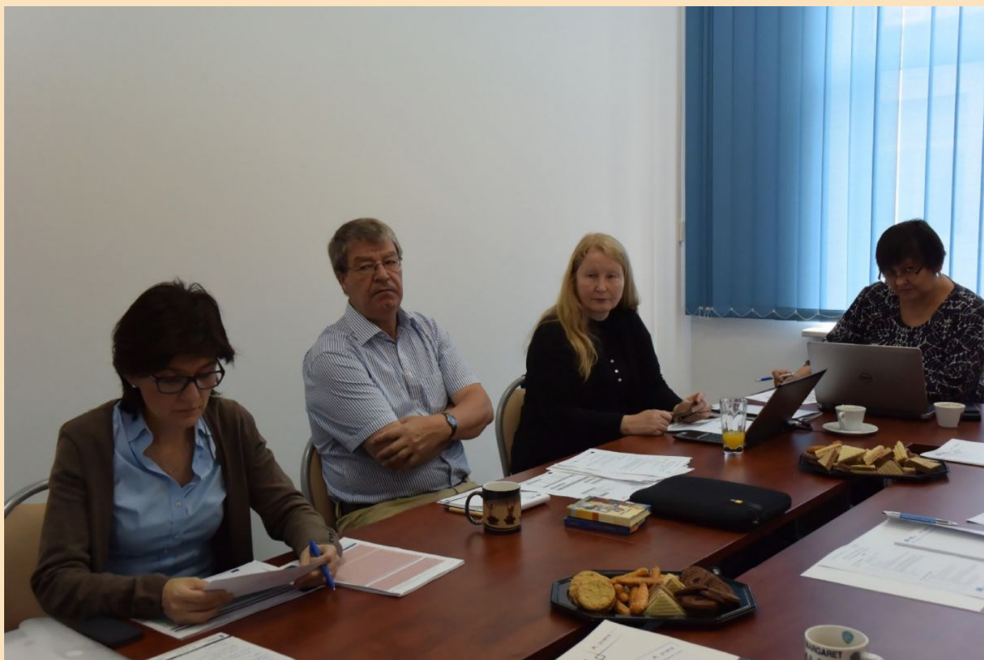
Spotkanie partnerów projektu TAP w Rzeszowie

Faza warsztatowa skupia się na opracowaniu metodologii i przeprowadzeniu warsztatów wśród grup docelowych projektu (osoby zagrożone ubóstwem i wykluczeniem społecznym, tj. osoby bezrobotne, o niskim poziomie kwalifikacji lub wykształcenia, samotnie wychowujące dzieci lub rodziny wielodzietne oraz osoby osiągające niskie dochody; decydenci i politycy społeczni). Rezultatami projektu będą publikacje naukowe oraz metodologie prowadzenia warsztatów w grupach docelowych projektu.