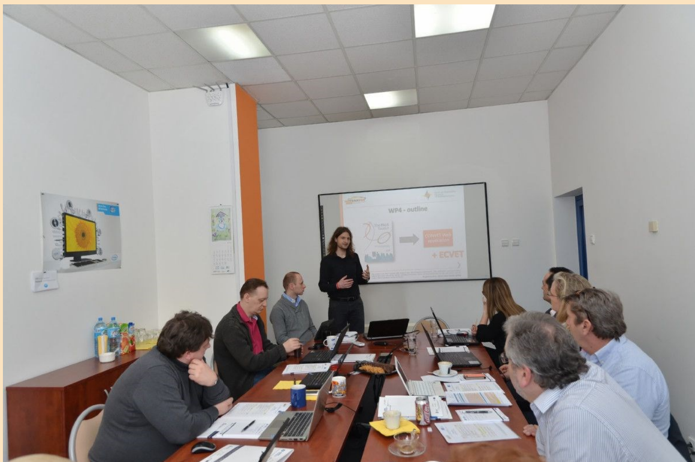
Spotkanie partnerów projektu CONVET w Rzeszowie