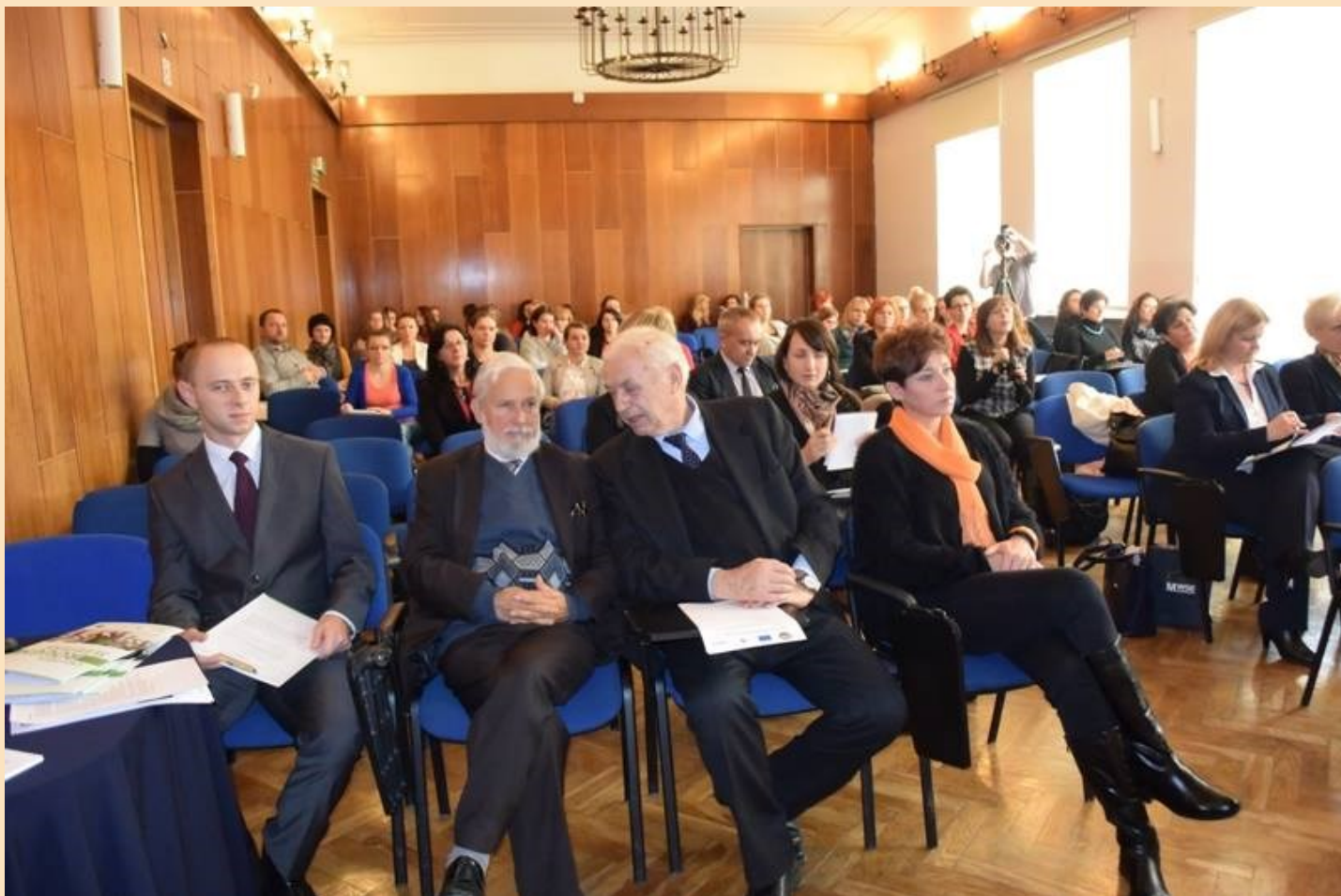
Debata podsumowująca konferencję